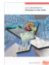
Leica MobileMatrix Catálogo producto