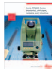
Leica TPS800 Catálogo producto