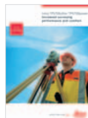
Leica TPS700 Catálogo producto

La marca y logos Bluetooth® en todo el mundo son propiedad de Bluetooth SIG, Inc. y su uso por marcas como Leica Geosystems AG es bajo licencia. Otras marcas registradas y nombres registrados son de sus respectivos propietarios.